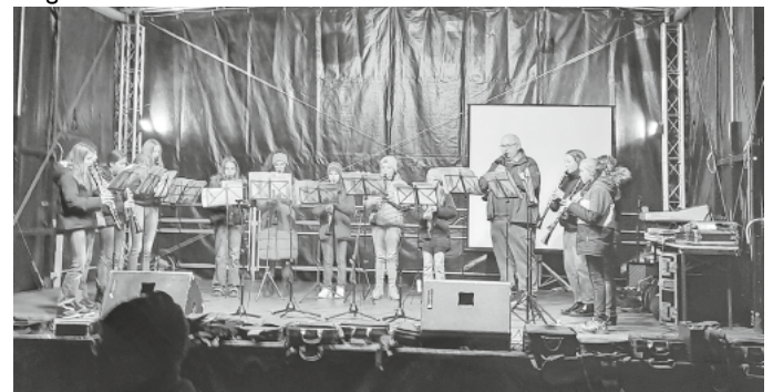
Das Klarinettenensemble unterhielt die Besucher mit den verschiedensten Weihnachtsliedern.