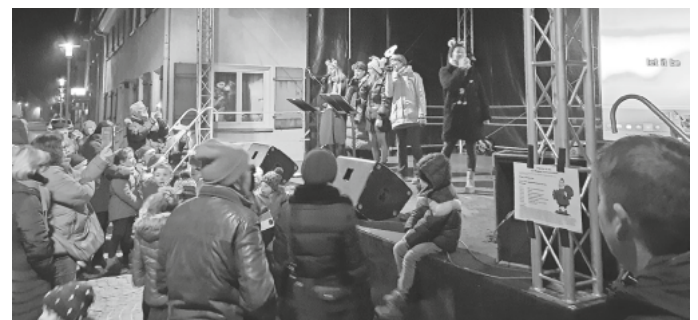
Beim Projekt „Mengen singt“ zählte jede Stimme.